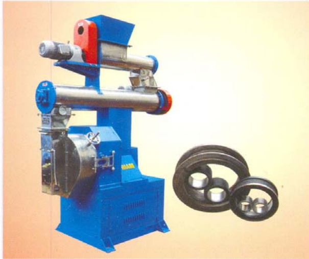
MÁY ÉP VIÊN EV-300A PELLET MILL EV-300A

Kiểu : EV - 300A Công suất: 22 Kw + 1,1 Kw + 1,1 Kw Năng suất: 1 - 1,5 T/h